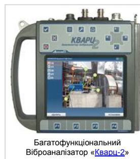
Багатофункціональний Вібраналізатор «Кварц-2»

✓ Для організації періодичного моніторингу та вібраційної діагностики обладнання перед вводом в експлуатацію та в процесі експлуатації, розроблені та постачаються портативні прилади для вимірювання і аналізу вібрації - ВІБРОМЕТРИ, АНАЛІЗАТОРИ ВІБРАЦІЇ, БАЛАНСУВАЛЬНІ ПРИЛАДИ. На підприємства України поставлено понад 300 одиниць.