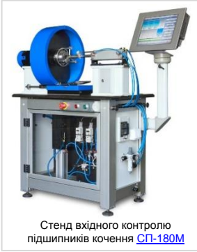
Стенд вхідного контролю підшипників кочення СП-180М

✓ В процесі виконання ремонту роторного обладнання, важливою складовою якісного ремонту є виконання високоточного балансування роторів на БАЛАНСУВАЛЬНОМУ ВЕРСТАТІ . ДП «ДІАМЕХ-УКРАЇНА» пропонує широку лінійку балансувальних верстатів для балансування роторів різної конфігурації від 30 грам до 127 тон, з горизонтальною та вертикальною віссю обертання. Понад 30 одиниць балансувальних верстатів виробництва ДІАМЕХ експлуатується на підприємствах України.