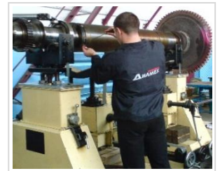
Балансувальний верстат ВМ-8000 Об'єкт оснащення ДК «Укртрансгаз»

✓ Для організації якісного вхідного контролю підшипників кочення спеціально розроблено СТЕНД ВХІДНОГО КОНТРОЛЮ ПІДШИПНИКІВ КОЧЕННЯ СП-180М . Використання стенду дозволить виключити використання неякісних підшипників в процесі виготовлення та ремонту, а також аргументовано пред'являти претензії та повертати неякісну продукцію постачальнику.