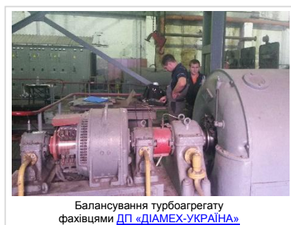
Балансування турбоагрегату фахівцями ДП «ДІАМЕХ-УКРАЇНА»

Окремим напрямком діяльності ДП «ДІАМЕХ-УКРАЇНА» є надання послуг з експертної вібраційної діагностики та балансування обладнання, розробка методик діагностування складного і особливо відповідального обладнання, організація та методичний супровід/консультування служб технічної діагностики підприємств.