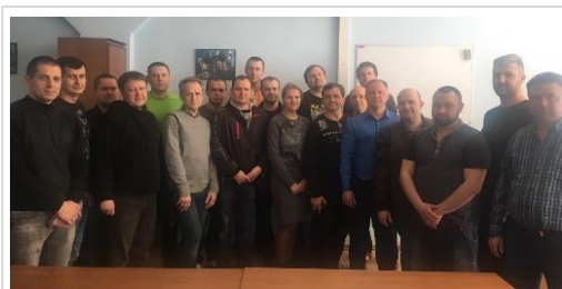
Випускники навчальних курсів «Вібродіагностика II рівень» 2018р.

Навчальний процес включає в себе як теоретичні так і практичні заняття. Учбові міста обладнанні комп'ютерами, вібровимірювальною апаратурою, учбово-демонстраційними стендами для моделювання різних дефектів роторного обладнання. В учбовому залі встановлено зразки балансувальних верстатів. Викладання проводять досвідчені фахівці ДП «ДІАМЕХ-УКРАЇНА» II та III рівня кваліфікації з великим практичним та теоретичним досвідом в вібраційній діагностиці обладнання. Фахівці ДП «ДІАМЕХ-УКРАЇНА» також проводять виїзне навчання по роботі з вібровимірювальною апаратурою та балансувальними верстатами на місці їх встановлення, безпосередньо у Замовника.